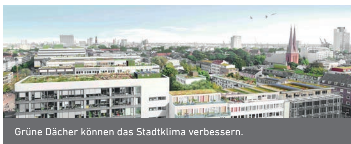
Grüne Dächer können das Stadtklima verbessern.

Im Förderbereich » Quartiersentwicklung und -erneuerung « werden insbesondere Maßnahmen zur Reduzierung des Ressourcenverbrauchs, zum schonenden Umgang mit den natürlichen Ressourcen, zum Klimaschutz und zur Klimaanpassung unterstützt. Dort können Ansätze der energetischen Quartierserneuerung und der Speicherung und Nutzung erneuerbarer Energien genauso Berücksichtigung finden wie die ressourcenschonende Modernisierung der leitungsgebundenen Infrastruktur und innovative Konzepte der grünen Infrastruktur.