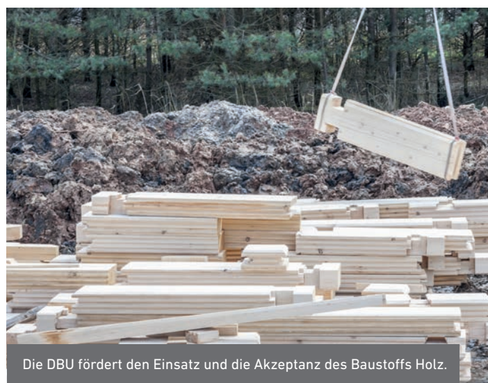
Die DBU fördert den Einsatz und die Akzeptanz des Baustoffs Holz.

Mit dem Förderthema » Klima- und ressourcenschonendes Bauen « zielt die DBU darauf ab, einen Beitrag zu einem klimaneutralen und gesundheitsfreundlichen Gebäudebestand bis 2050 zu leisten. Zum einen soll das Potenzial energetisch optimierter Gebäudebestände modellhaft erschlossen werden. Zum anderen gilt es, zukunftsfähige Konzepte und technologische Ansätze als primäre Innovationstreiber zu entwickeln und zu erproben. Die DBU fördert hier insbesondere die ganzheitliche Optimierung innerhalb einer integralen Planungsphase. Ein konkreter Förderansatz ist der verstärkte Einsatz des nachwachsenden Rohstoffs Holz.