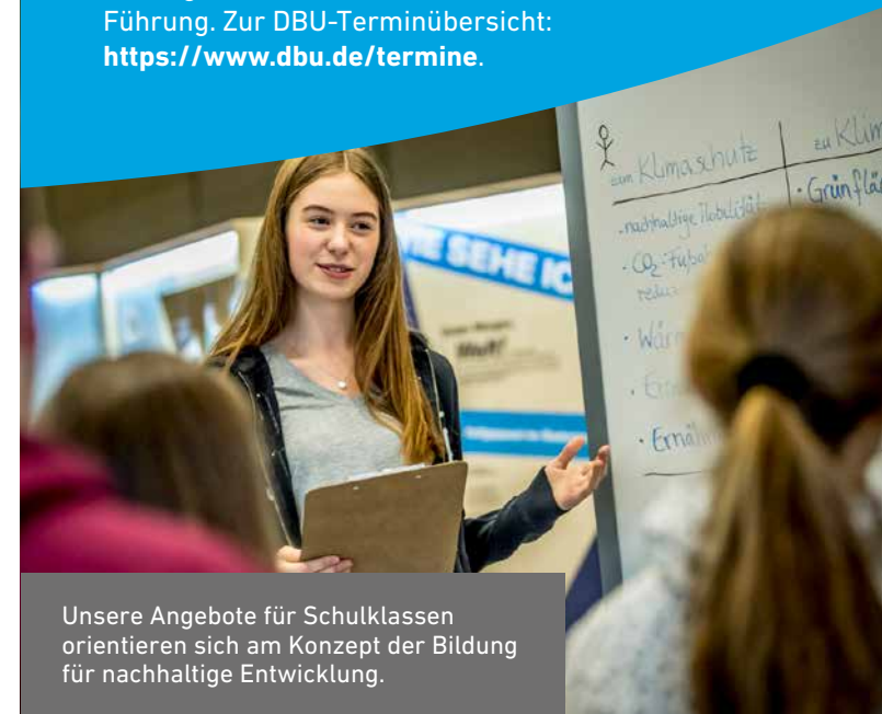
Unsere Angebote für Schulklassen orientieren sich am Konzept der Bildung für nachhaltige Entwicklung.

Begleitend zu der Ausstellung finden einmal im Monat Vorträge statt. Diese beinhalten auch eine öffentliche Führung. Zur DBU-Terminübersicht: https://www.dbu.de/termine .