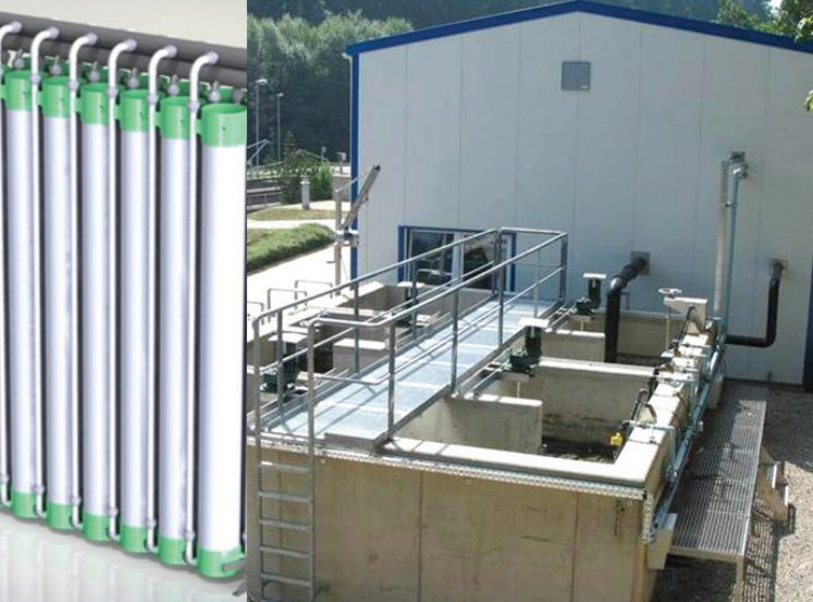
Geplantes Demonstrationsprojekt für die Kläranlage Simmerath

Es ist geplant, die positiven Ergebnisse im technischen Maßstab während eines Dauerbetriebs zu verifizieren. Aus diesem Grund ist ein zweites Teilprojekt als Fortführung des ersten Teilvorhabens geplant, in dem die neuen Membranfilter in der vorhandenen Demonstrationskläranlage für MBR-Module in Simmerath im Dauerbetrieb zum Einsatz kommen.