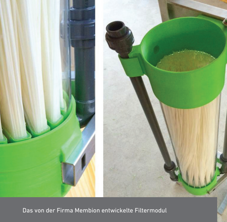
Das von der Firma Membion entwickelte Filtermodul

In einem ersten Schritt wurden die Kunststoffteile des Filters so angepasst, dass eine zufriedenstellende Montierbarkeit des Moduls in einem Gestell für den Praxistest möglich war. Anschließend wurde das Funktionsmuster des neuen Membranfilters zunächst ohne und dann mit Membranen in Klarwasser getestet und angepasst, bevor es unter realen Bedingungen einer Membrankläranlage auf der Anlage in Konzen des Wasserverbands Eifel-Rur in Betrieb genommen wurde.